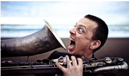
Billede: Ilt, en co-produktion af Glimt og ZEBU

Kommunikationsstrategien har desuden fokus på at få de gode historier om den frie scenekunst og Udviklingsplatformens virke bredere ud til branchen og kulturlivet. Gennem bl.a. mediasamarbejder med Iscene.dk vil Udviklingsplatformen bistå det frie felts stemme i den offentlige debat.